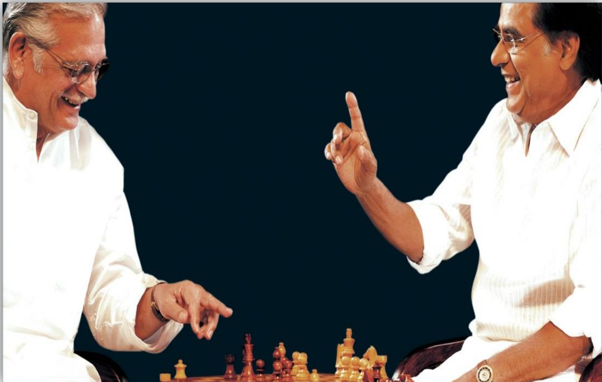
Gulzar & Jagjit Singh

This photograph captures genuine laughter while playing chess with Jagjit. The photo shoot for the album cover of 'Koi Baat Chale' was ongoing and we played the game in between photo shoots. I caught Jagjit cheating! He moved his Knight 3\frac{1}{2} squares. I pointed out that the correct move is 2\frac{1}{2} squares! Jagjit said that he owns race horses and his horse moves 3\frac{1}{2} squares!